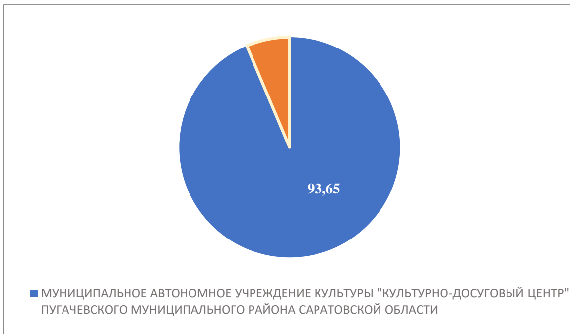
Рисунок 5 – Интегральный показатель по критерию «Удовлетворенность условиями оказания услуг»

По пятому критерию «Удовлетворенность условиями оказания услуг» МУНИЦИПАЛЬНОЕ АВТОНОМНОЕ УЧРЕЖДЕНИЕ КУЛЬТУРЫ «КУЛЬТУРНО-ДОСУГОВЫЙ ЦЕНТР» ПУГАЧЕВСКОГО МУНИЦИПАЛЬНОГО РАЙОНА САРАТОВСКОЙ ОБЛАСТИ набрало 93,65 балла (Рис. 5)