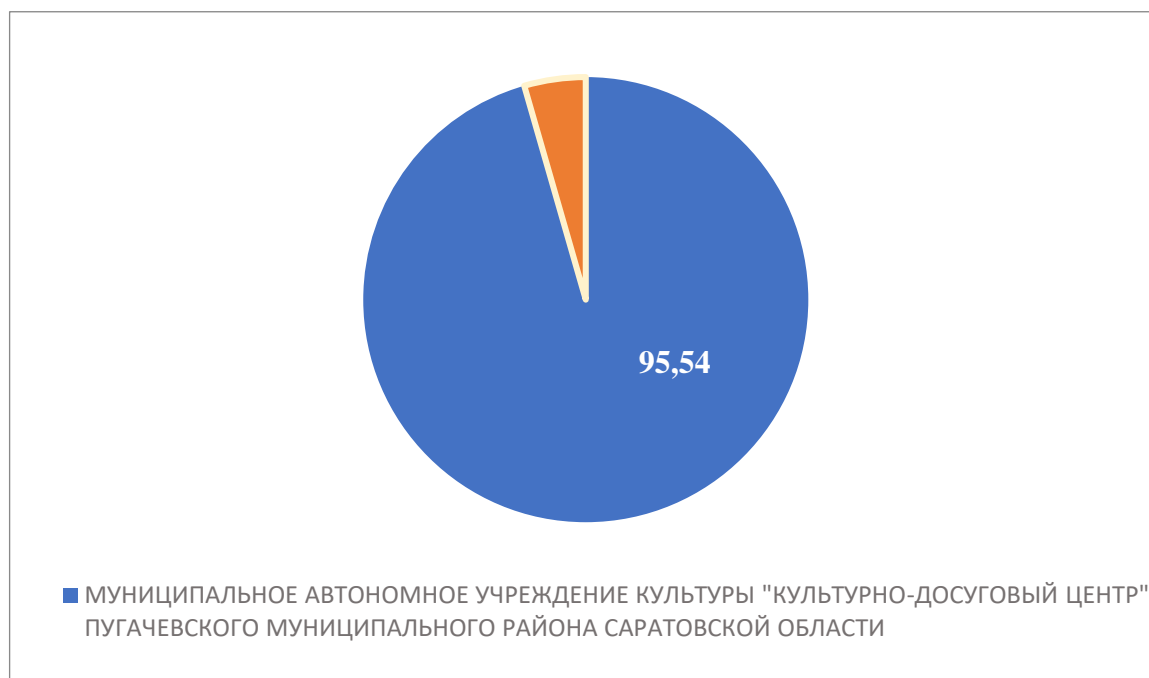
Рисунок 2 – Интегральный показатель по критерию «Комфортность условий предоставления услуг»

По второму критерию «Комфортность условий предоставления услуг» МУНИЦИПАЛЬНОЕ АВТОНОМНОЕ УЧРЕЖДЕНИЕ КУЛЬТУРЫ «КУЛЬТУРНО-ДОСУГОВЫЙ ЦЕНТР» ПУГАЧЕВСКОГО МУНИЦИПАЛЬНОГО РАЙОНА САРАТОВСКОЙ ОБЛАСТИ набрало 95,54 балла (Рис.2)