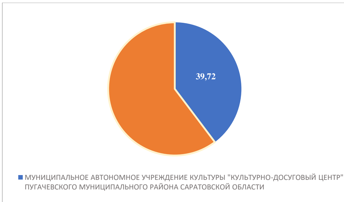
Рисунок 3 – Интегральный показатель по критерию «Доступность услуг для инвалидов»

По третьему критерию «Доступность услуг для инвалидов» МУНИЦИПАЛЬНОЕ АВТОНОМНОЕ УЧРЕЖДЕНИЕ КУЛЬТУРЫ «КУЛЬТУРНО-ДОСУГОВЫЙ ЦЕНТР» ПУГАЧЕВСКОГО МУНИЦИПАЛЬНОГО РАЙОНА САРАТОВСКОЙ ОБЛАСТИ набрало 39,72 балла (Рис.3).